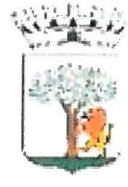
Comune di Noci