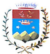
Comune di Putignano